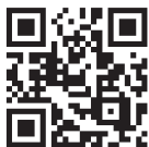
地域探究アワード